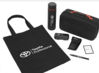
Zestaw prezentowy Professional Gadżety